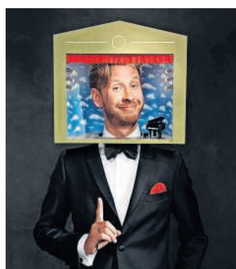
▲ De première van Booms cabaret.

Nationaal Allerzielen Concert, NPU, zondag 3 nov, 14 uur, Hertz, TivoliVredenburg, Utrecht.